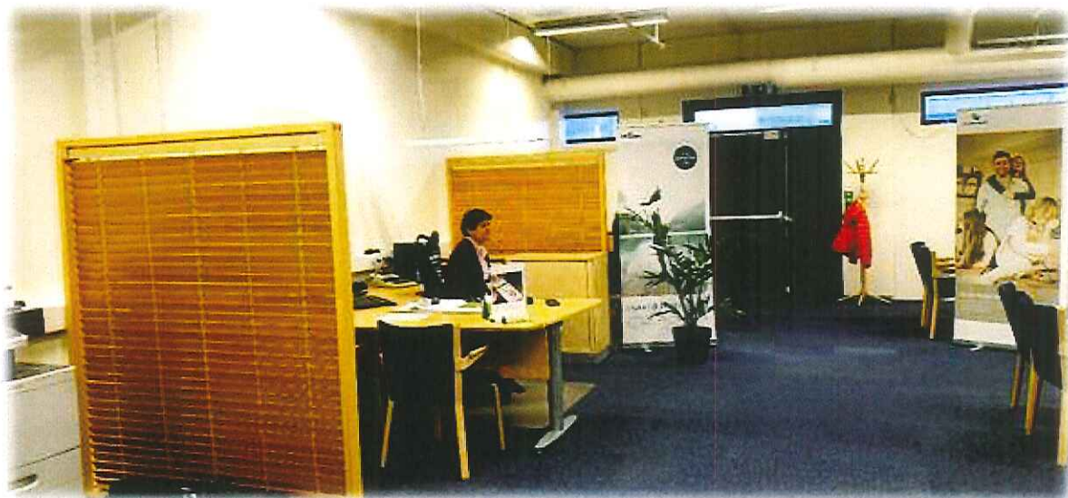
Fra bankens midlertidige lokaler i Bølgen, Elnesvågen