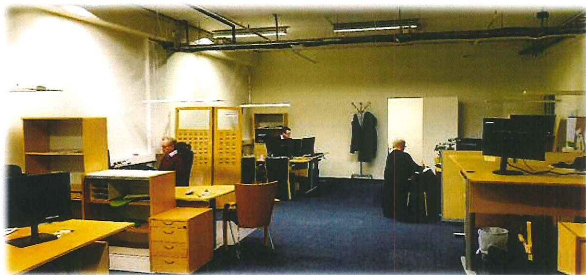
Fra bankens midlertidige lokaler i Bølgen, Elnesvågen