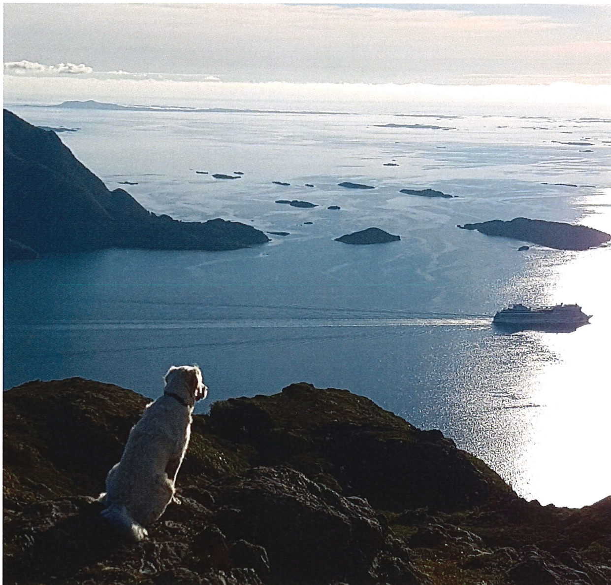
«Rishaltheia, Molde kommune»