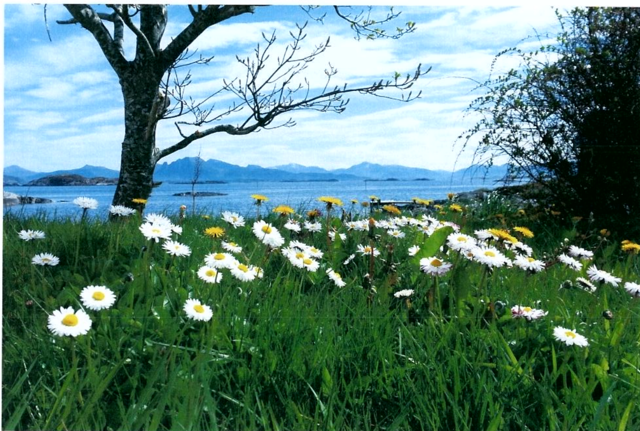
«Blomster på Søre Bjørnsund»